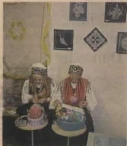
Lepoglavska čipka kao turistička atrakcija PD

Na inicijativu grada osnovana je 2003. Zadruga lepoglavska čipka kako bi se obnovila tradicija njezine izrade jer joj je prijetila opasnost izumiranja. Radile su je uglavnom starije žene, a znanje izrade prenosilo se generacijama. Stvorena je nova generacija čipkarica tako da danas zadruga broji 78 članica. Izradene čipke se redovno otkupljuju i prodaju kao visokovrijedne rukotvorine. br